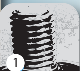
Teclas de bloqueo para un fácil montaje